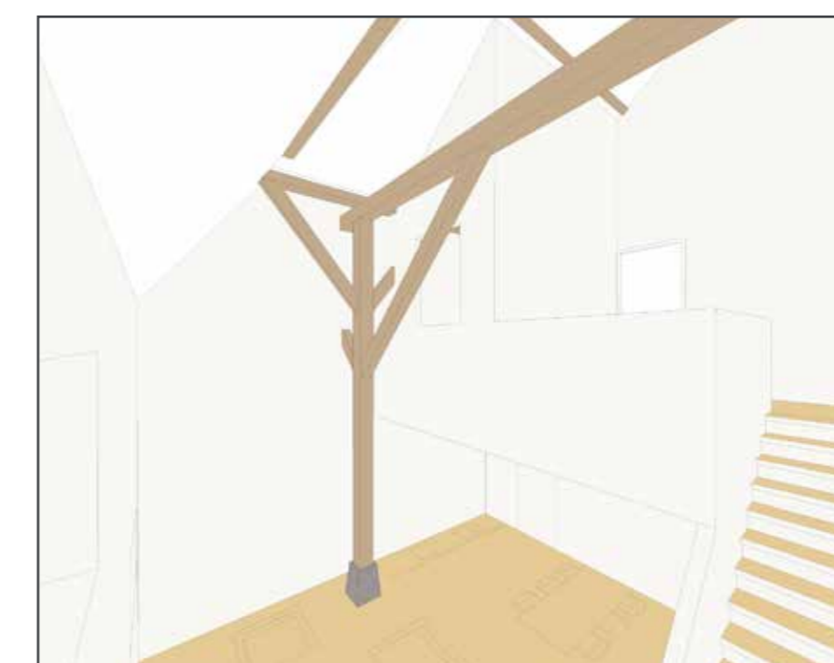
► Zichtpunt (schematisch) niet op schaal